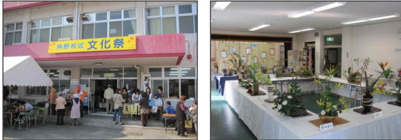
※写真は前回の文化祭の様子です。

前月号でお知らせしましたように、来る11月7日(日)に、角野公民館、角野小学校体育館において、第50回角野校区文化祭が開催されます。