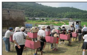
↑ さあ、みんなで塩作り！！