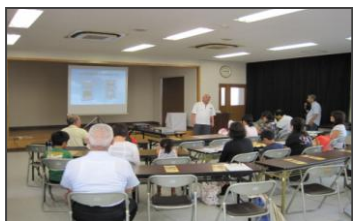
↑ ビデオ研修の様子です。