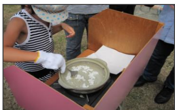
↑ きれいな塩が作れたよ！