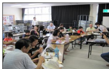
↑ 出来たての塩をつけて食べるじゃがいもは、最高！！