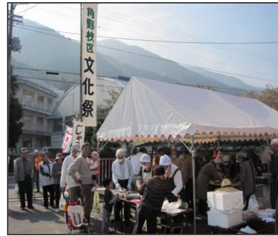
【角野校区文化祭実行委員会】

天候にも恵まれ、多くの方々が会場に足を運んでくださいました。準備から片付けまでお手伝いをしてくださったスタッフのみなさん、本当にありがとうございました。