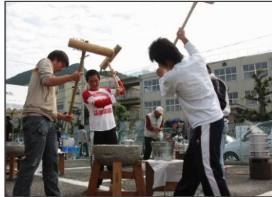
※写真は前回の文化祭の様子です。

前号でお知らせしましたように、来る11月8日(日)に、角野公民館、角野小学校体育館において、第49回角野校区文化祭が開催されます。