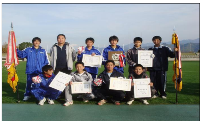
大会新記録で初優勝した 角野男子チームのみなさん

男子チームは、県代表として、12月21日に山口県山口市で開催の、 全国中学校駅伝大会に初出場し、 14位と大健闘しました。