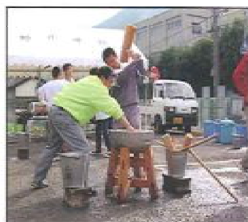
※写真は前回の文化祭の様子です