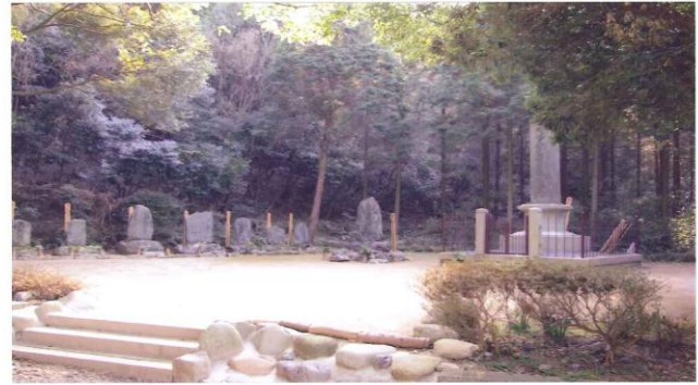
← 住友鉦山関係者の墓園

さてこの人達が眠るお墓の場所ですが、本堂、庫裡の西隣に「ひかり幼稚園」がありますがその裏側の山にありまして、その最上段には、瑞応寺歴代の住職の蘭塔場があります。さらに西に進みますと住友関係者の墓園があります。